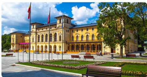
Stary Dom Zdrojowy