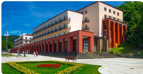
Nowy Dom Zdrojowy